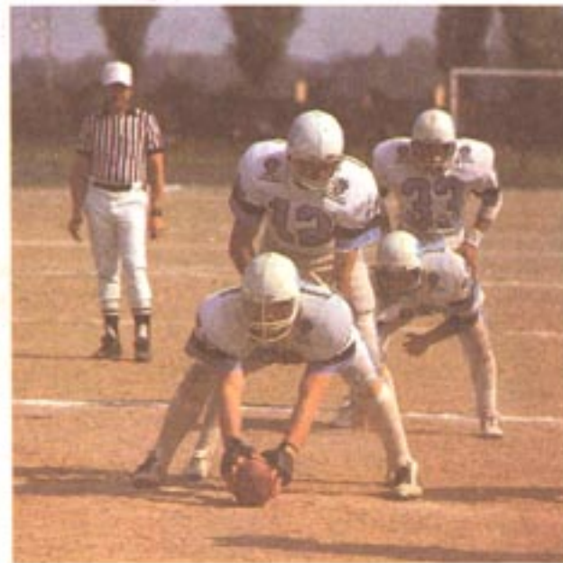
I Condors e i Grizzlies, le due più grosse sorprese di questo Campionato, hanno già matematicamente ottenuto la qualificazione ai play-off